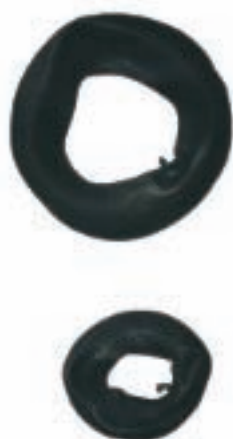
AN 0008 AN 0009