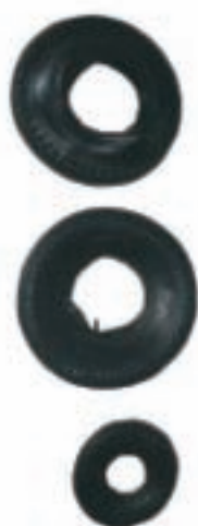
AN 0127 AN 0128 AN 0133