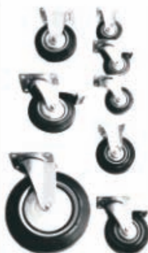
PO 0014 PO 0012 PO 0016 PO 0015 PO 0013 PO 0017